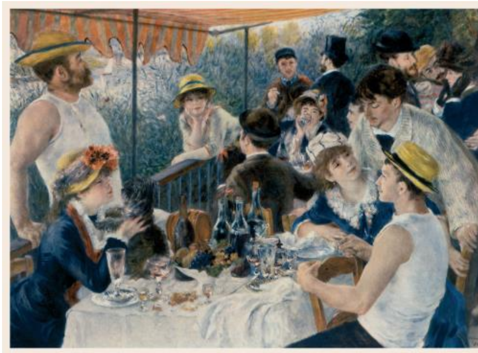
Le déjeuner des canotiers Le Déjeuner des canotiers est une huile sur toile du peintre impressionniste français Auguste Renoir réalisée en 1880