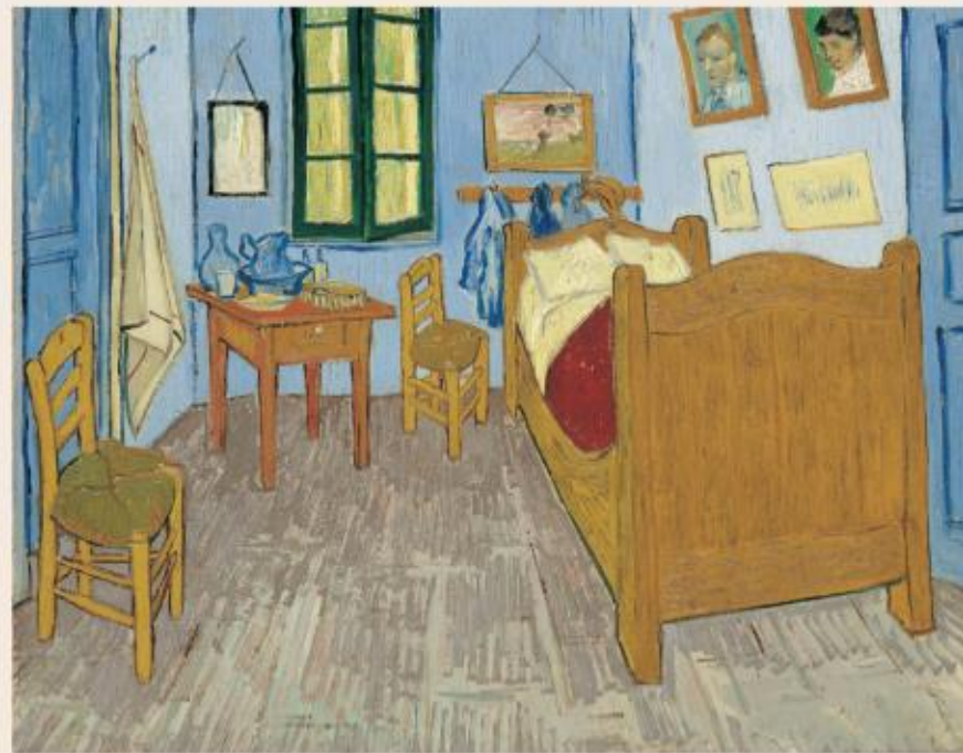
La Chambre de Van Gogh à Arles est une peinture à l'huile sur toile de 72 × 90 cm. Elle a été réalisée par le peintre Vincent van Gogh en 1888 . Elle se trouve au musée Van Gogh à Amsterdam .