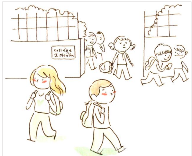
Un bisou pas fait exprès sur la bouche