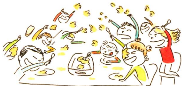
Deux bandes ennemies qui se lançaient de la purée à la cantine