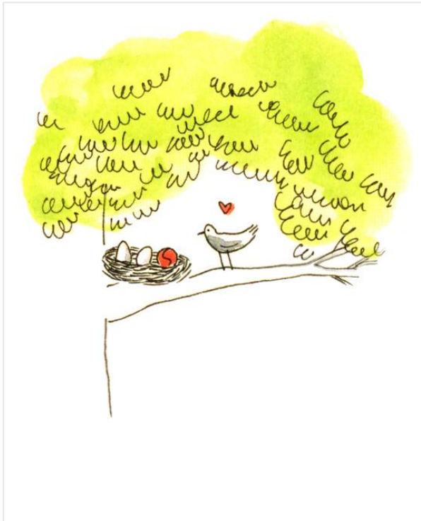
Une balle lancée jamais retrouvée