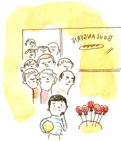
Un garçon qui ne savait pas se décider entre sucette au coca et sucette à la fraise