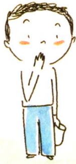
Un garçon qui avait avalé une bille