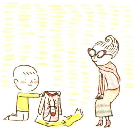
Un cadeau pas tout à fait comme on voulait