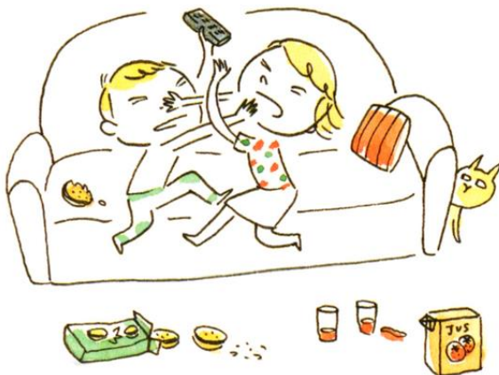
Une télécommande qui tombait tout le temps par terre (toute seule)