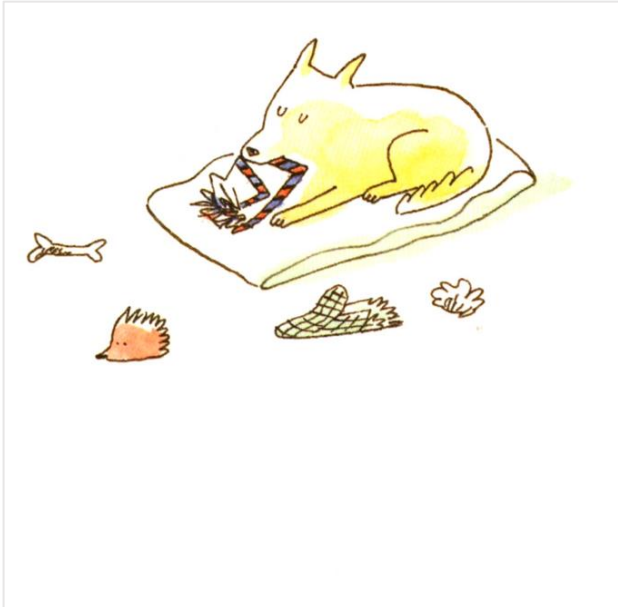
Une lettre qui n'arrivait pas