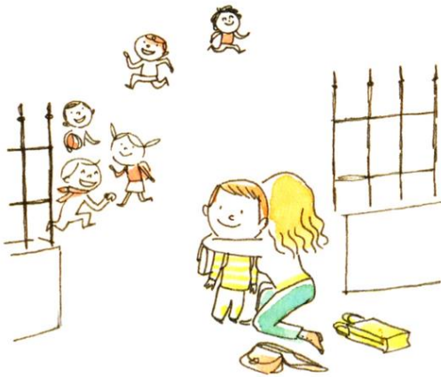
Un dernier câlin devant la barrière de l'école