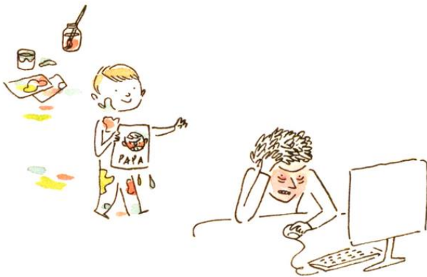
Un papa qui s'énevrait devant son ordinateur