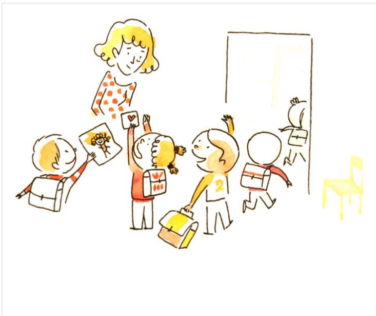
Une maîtresse toute chamboulée de dire adieu à sa classe