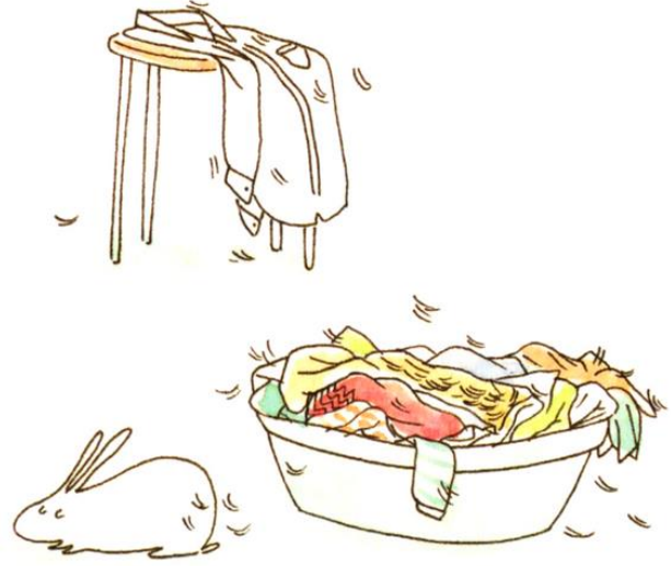
Un lapin qui perdait ses poils