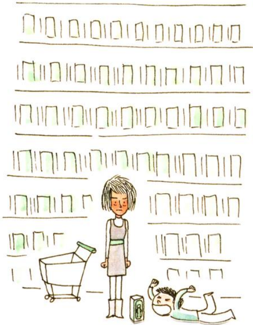
Une maman qui disait « Non, non, non » puis « Oui » quand même