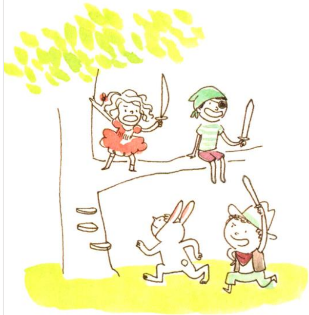
Une princesse avec du chewing-gum dans les cheveux