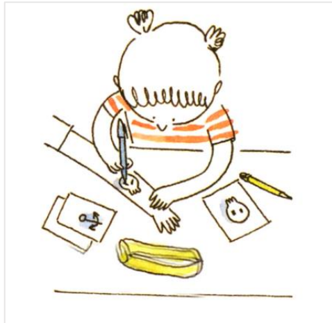
Un tatouage au stylo-bille