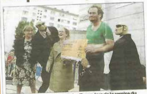
La joie des artistes, sous l'œil des Tonys, lors de la remise du prix.

OFF Les votants ont désigné « T'emmêle pas », le spectacle d'une jeune compagnie de Chambéry